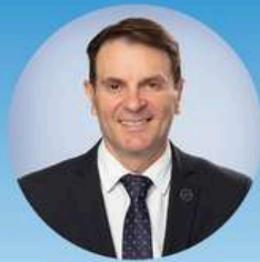
François Bonnardel Ministre de l'Immigration, de la Francisation et de l'Intégration Leader parlementaire